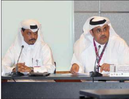
وزير التعليم العالي والبحث العلمي