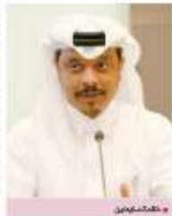
عبدالله بن حمد العطية

بمستويات ومبادرات ذات مستوى عالي بينما هم بحاجة إلى المزيد من التدريب والتعليم، خاصة في ظل التحولات التي يشهدها سوق العمل في قطر. وأكد أن أحد أهداف المعرض المهني 2013 هو توفير الفرص للمهنيين والمهنيات من كافة التخصصات في القطاع الخاص والعام، إضافة إلى إتاحة الفرصة للمؤسسات التعليمية لتقديم خدماتها في مجال التدريب والتأهيل. وقال أن عدد الزوار يمتد عبر مختلف محافظات دولة قطر من 200 فرقة تدريبية خلال الفترة الممتدة للمعرض، من بينها 100 فرقة تدريبية لقطاع الأعمال والقطاع التعليمي، إضافة إلى 100 فرقة تدريبية لقطاع الصحة والقطاع السياحي، إضافة إلى 200 فرقة تدريبية لقطاع الخدمات. وأكد أن المعرض المهني 2013 هو فرصة للمؤسسات التعليمية لتقديم خدماتها في مجال التدريب والتأهيل، إضافة إلى إتاحة الفرصة للمؤسسات التعليمية لتقديم خدماتها في مجال التدريب والتأهيل.