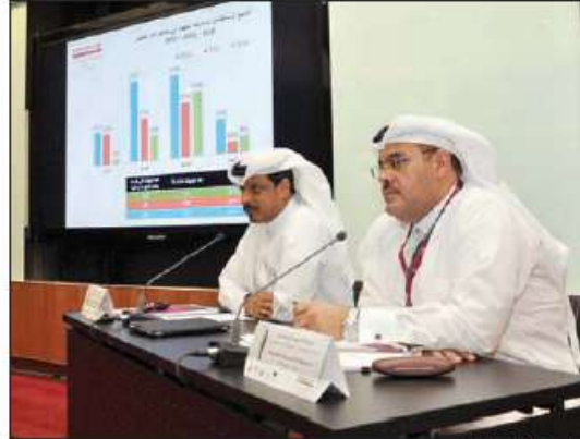
وزير التعليم العالي والبحث العلمي