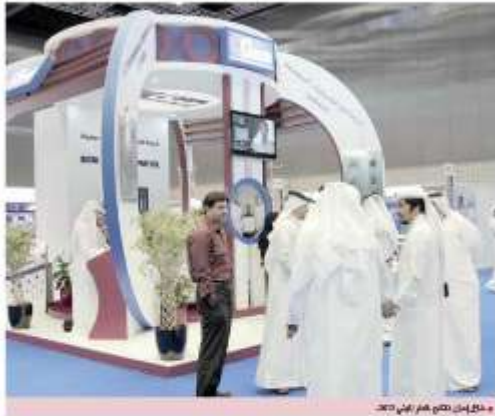
مخلافين كثر في المعرض 2013

بمستويات ومبادرات ذات مستوى عالي بينما هم بحاجة إلى المزيد من التدريب والتعليم، خاصة في ظل التحولات التي يشهدها سوق العمل في قطر. وأكد أن أحد أهداف المعرض المهني 2013 هو توفير الفرص للمهنيين والمهنيات من كافة التخصصات في القطاع الخاص والعام، إضافة إلى إتاحة الفرصة للمؤسسات التعليمية لتقديم خدماتها في مجال التدريب والتأهيل. وقال أن عدد الزوار يمتد عبر مختلف محافظات دولة قطر من 200 فرقة تدريبية خلال الفترة الممتدة للمعرض، من بينها 100 فرقة تدريبية لقطاع الأعمال والقطاع التعليمي، إضافة إلى 100 فرقة تدريبية لقطاع الصحة والقطاع السياحي، إضافة إلى 200 فرقة تدريبية لقطاع الخدمات. وأكد أن المعرض المهني 2013 هو فرصة للمؤسسات التعليمية لتقديم خدماتها في مجال التدريب والتأهيل، إضافة إلى إتاحة الفرصة للمؤسسات التعليمية لتقديم خدماتها في مجال التدريب والتأهيل.