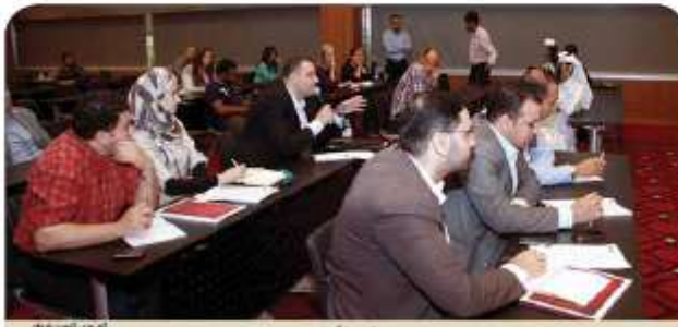
المعرض تاهير برك

145 شركة تقدم أكثر من 14500 فرصة توظيف اليوم